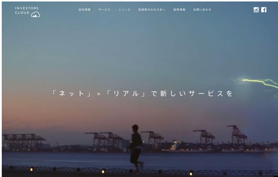
〈インベスターズクラウド社 web サイト〉